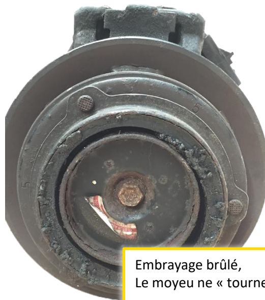
Embrayage brûlé, Le moyeu ne « tourne » pas

Les pièces retournées avec l'un des défauts ci-dessus ne donneront pas lieu à un avoir de carcasse. (La liste des pannes présentées dans ce document est non exhaustive).