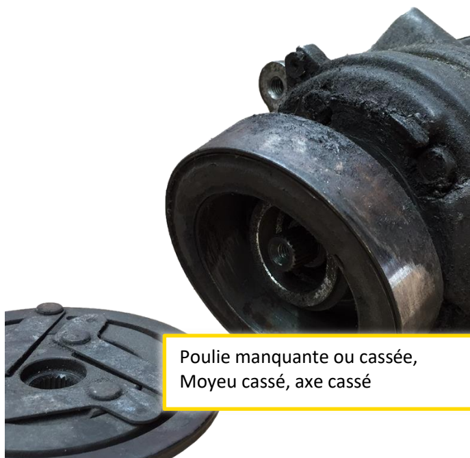
Poulie manquante ou cassée, Moyeu cassé, axe cassé